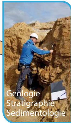
Geologie Stratigraphie Sedimentologie